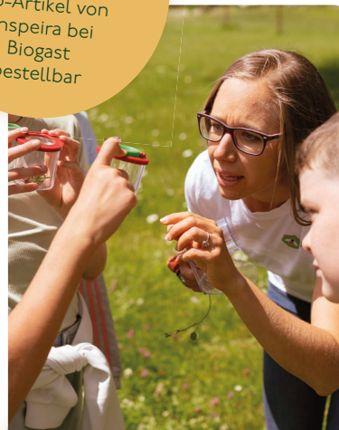
BeeWild: Das Summen darf nicht verstummen.