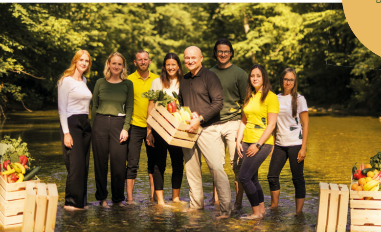
Gemeinsam Bio besser machen – Bio-Produkte auswählen, Partner vernetzen und Ideen wachsen lassen.