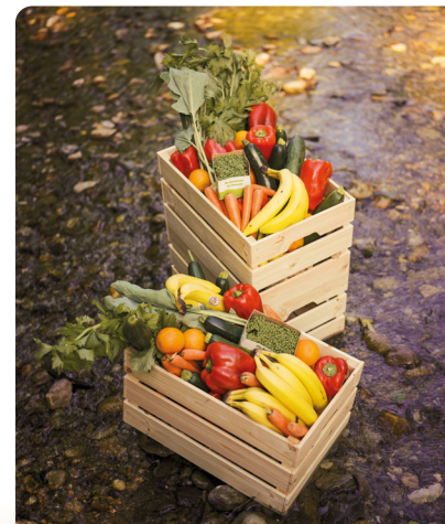
Unser Versprechen: 100% Bio, 100% Frisch & 100% Biofachhandel.